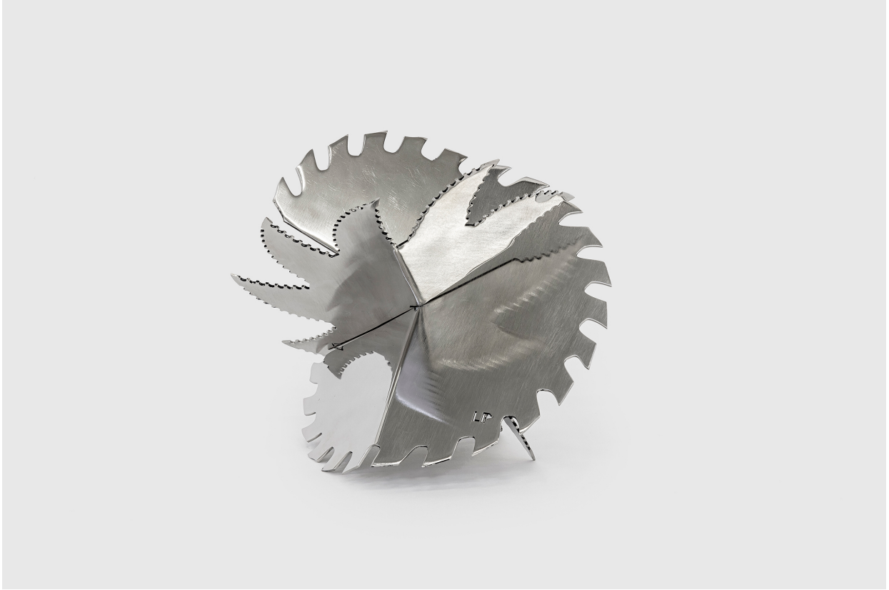
Bixinha Ouriço Circular Hexagonal (Hexagonal Circular Bixinha), 2022