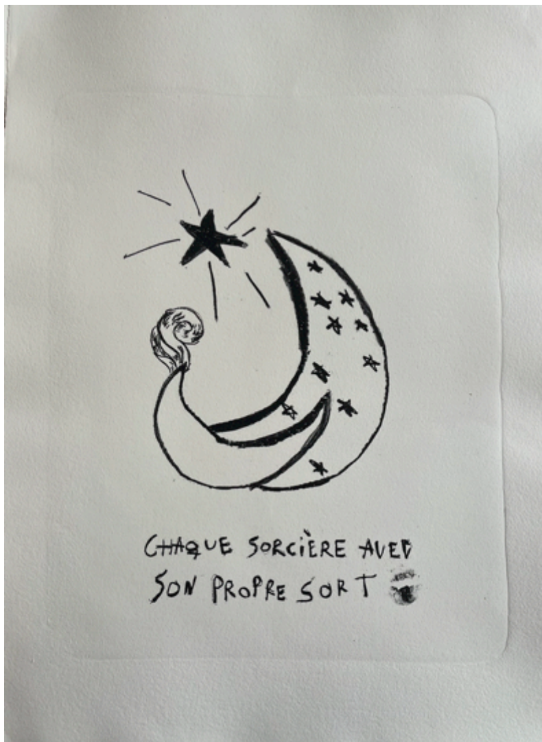
Chaque sorcière avec son propre sort, 2024