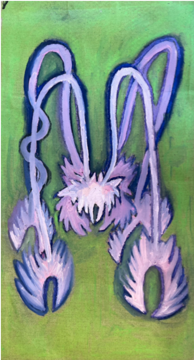
Sort affamé, 2023 Fusain, pastel et huile sur lin 73 x 39cm