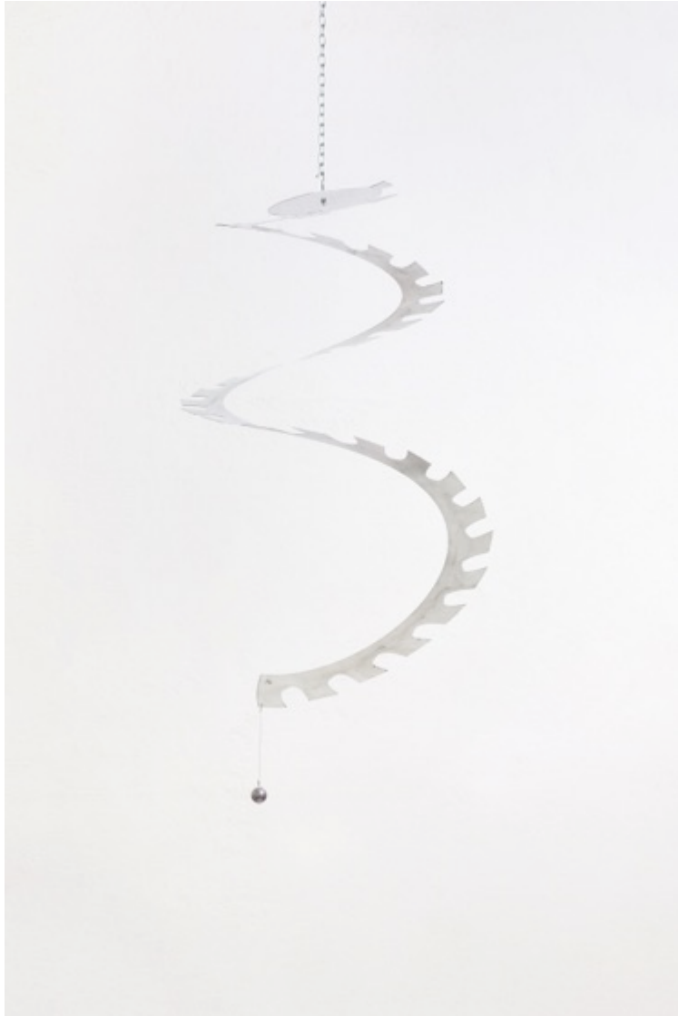
Scie vortex 50, 2022

Aluminium poli, fer, chenne, cable de fer, engine electrique 50 cm diametre 105 cm height