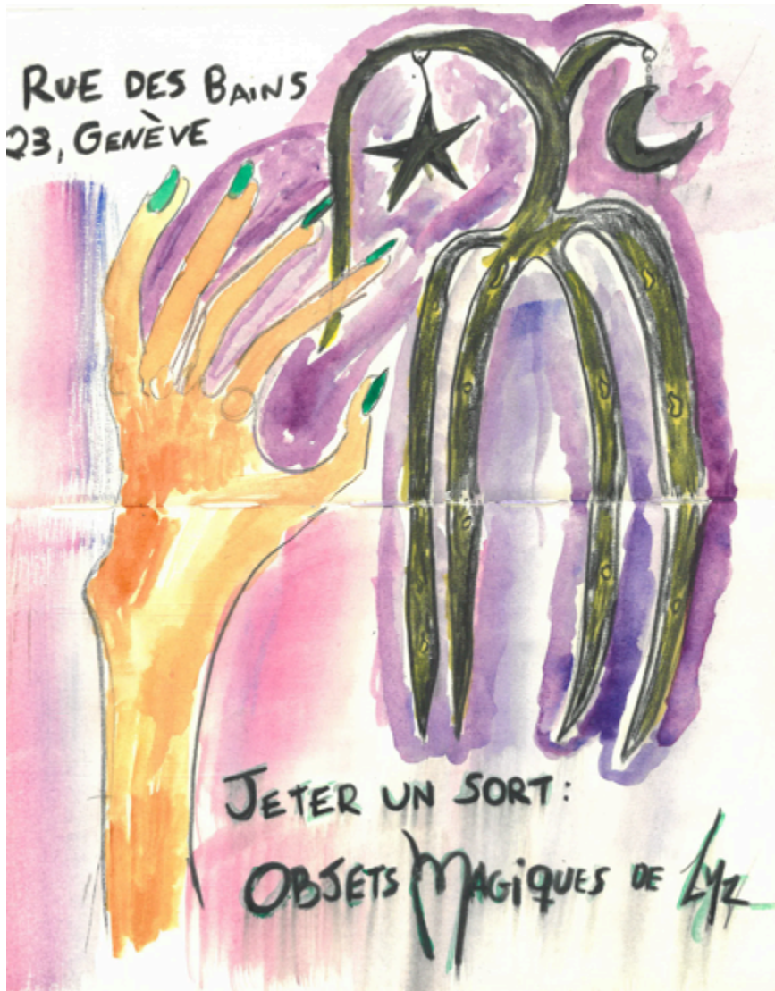
Jeter un sort: objets magiques de Lyz, 2024 Aquarelle et crayon sur papier 24,5 x 20 cm