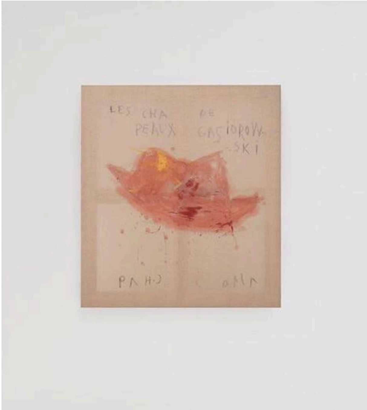
Les chapeaux de Gasiorowski, 1/10, 2019