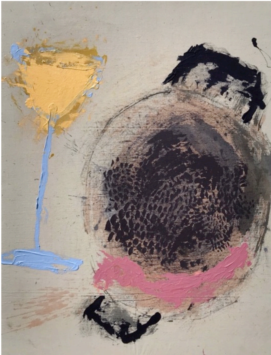
Riz noir, langoustine et vin blanc, 2020 Acrylique sur vieux lin 116 x 89 cm col. privé