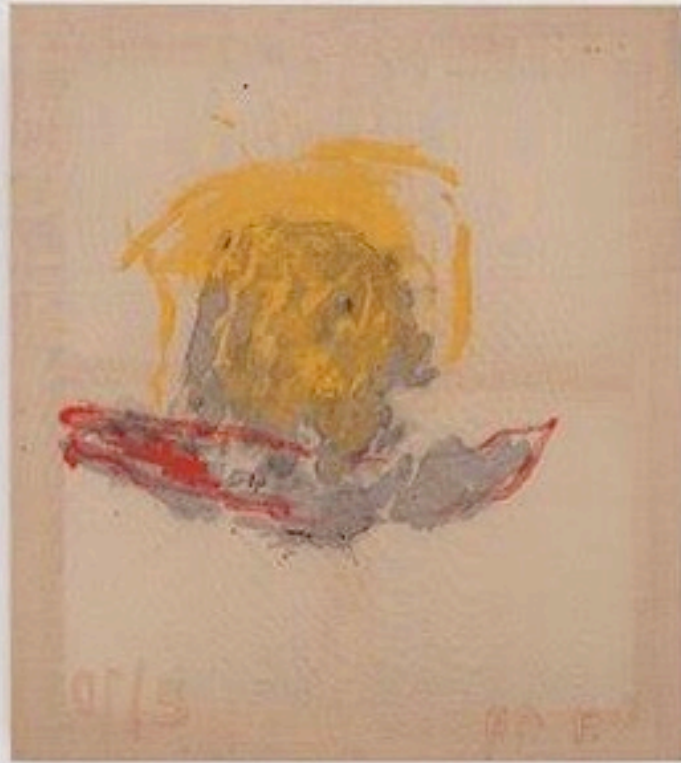
Les chapeaux de Gasirowski, 5/10, 2019