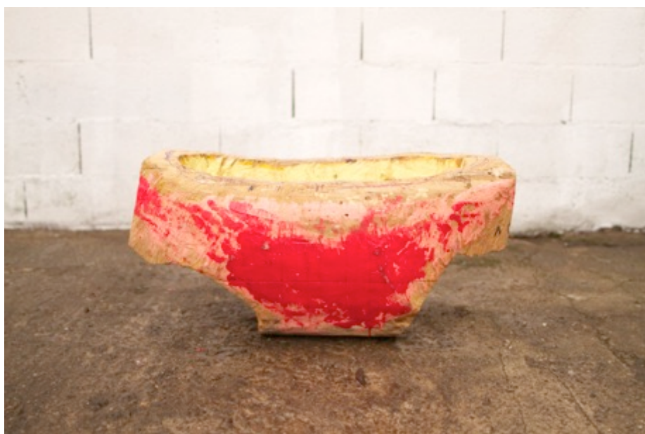
Slip de Georg, 2017 Technique mixte sur châtaignier 80 x 45 x 25 cm