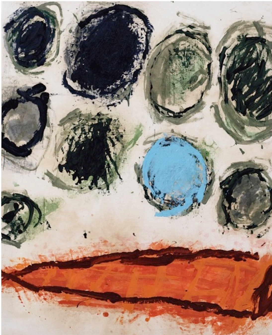
Petits pois carotte , 2020 Acrylique sur vieux coton 160 x 130 cm