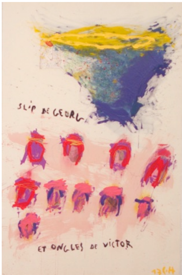
Slip de Georg et Ongles de Victor, 2017 Technique mixte sur velours peau de pêche, époque empire 190 x 130 cm