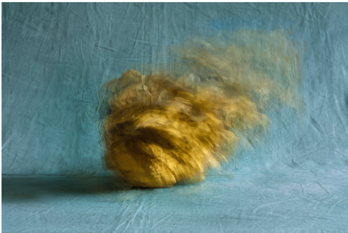
Omnipresent, 2019 c-print sur papier coton Ed 1/3 + 2EA 60 x 80 cm