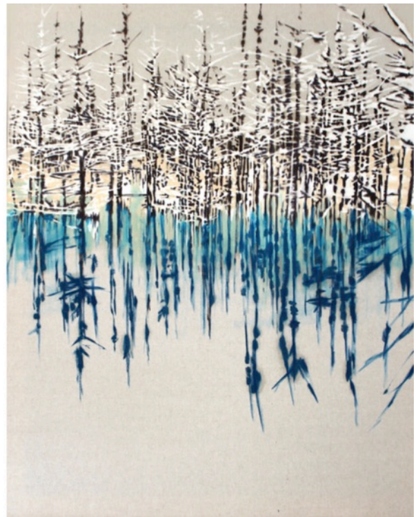
Infinity, 2019 Diptyque Huile sur toile 114 x 144 cm chaque