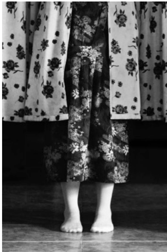
Dark flower, 2018