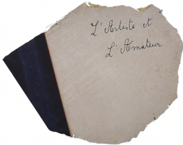
Sans titre, 2023 Série Pre-Seen Impression sur pierre de Bourgogne 69 x 80 cm

L'artiste s'intéresse aux réserves des musées, aux appartements de collectionneurs, aux lieux où les multinationales exposent et stockent leurs acquisitions d'art. Plus spécifiquement, il se concentre sur la façon dont les œuvres entrent en relation avec ces contextes particuliers. À travers la photographie, les arts plastiques, et l'installation, il révèle les espaces comme des lieux d'échanges, où les éléments, œuvres d'art, architecture, et matières — communiquent. Son travail a fait notamment l'objet d'expositions au Musée de l'Élysée, au Centre PasquArt, à la Galerie Azzedine Alaïa, à la Tap Seac Gallery Macau ou à Aperture New York. Il a remporté la bourse de la relève photographique Pro Helvetia et le prix Raymond Weil.