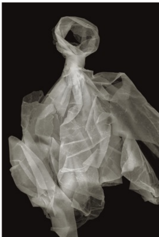
Composition 467, 2022

Il reçoit en 2014 le Quartz de la meilleure photographie du cinéma suisse. Entre deux projets cinématographiques, Denis poursuit assidûment une œuvre photographique personnelle et, en 2010, son travail obtient le Swiss Photo Award.