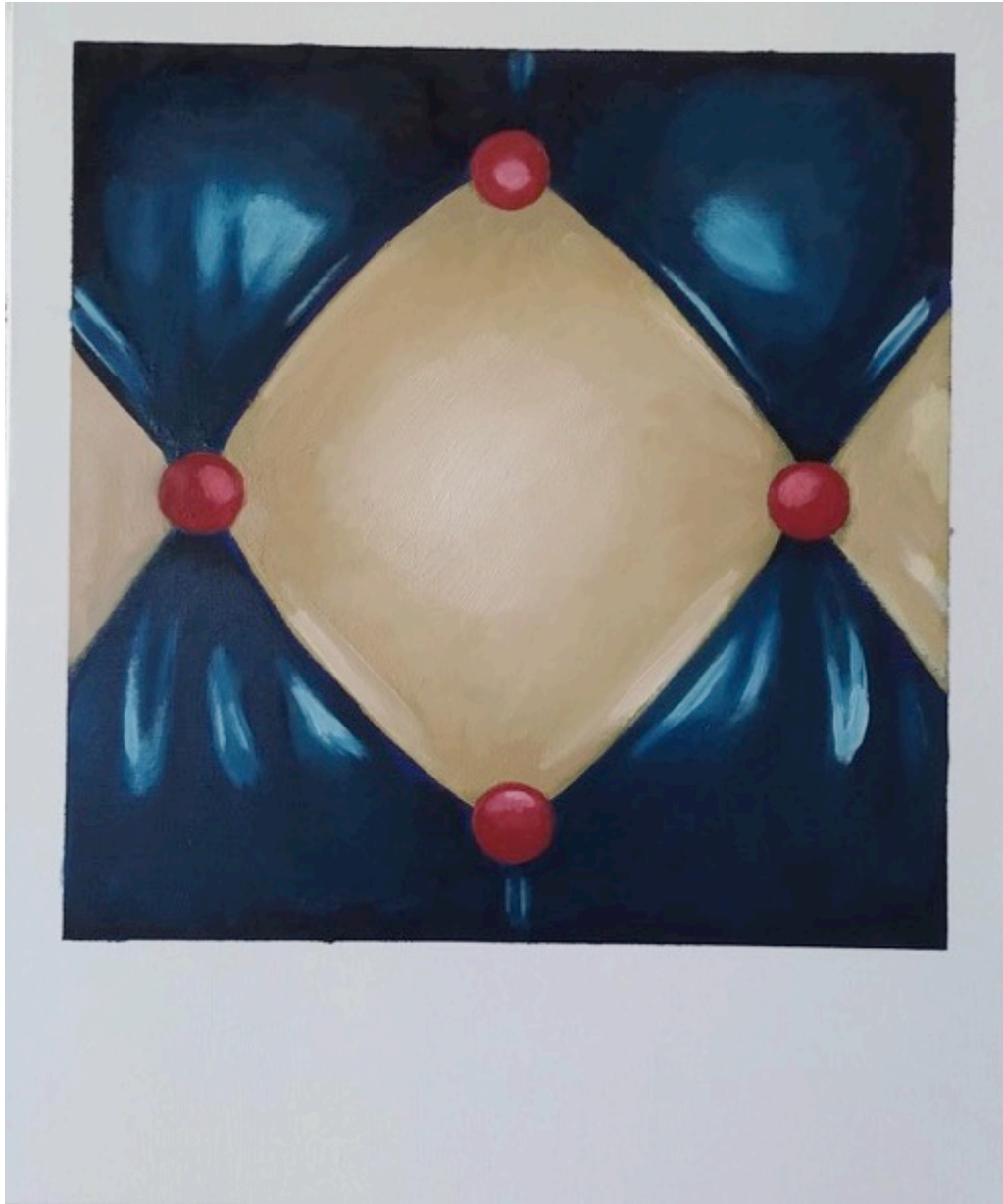
Cushion, Série Polaroid, 2022