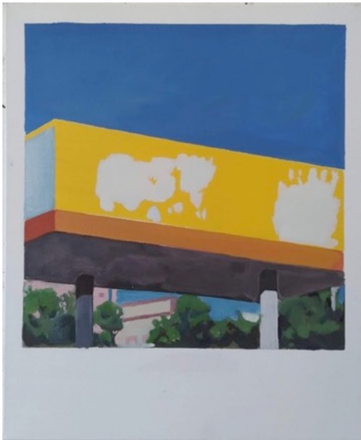
Lubrax, Série Polaroid, 2022

L'artiste a travaillé avec plusieurs langages tels que la peinture, la gravure, l'installation et la vidéo. En peinture, Marcolini apporte une réflexion sur la ville. Ses images sont vidées du sujet, mais portent des marques ou des indications de sa présence antérieure. En ce qui concerne les aspects formels de sa production, l'influence de l'architecture est indiscutable, tant dans la composition des plans que dans la recherche de la relation entre l'individu et l'espace.