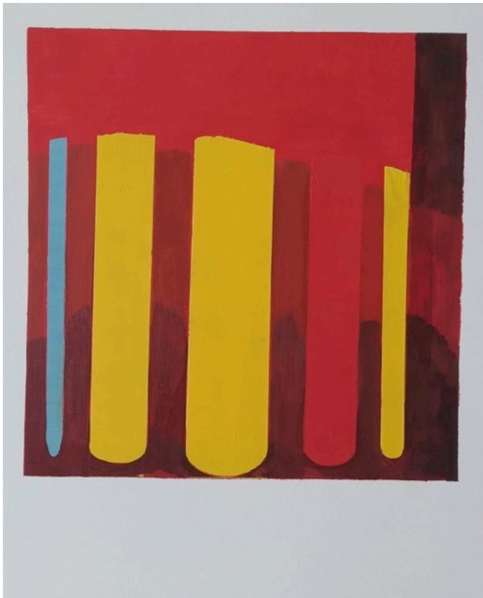
Luminoso, Série Polaroid, 2022