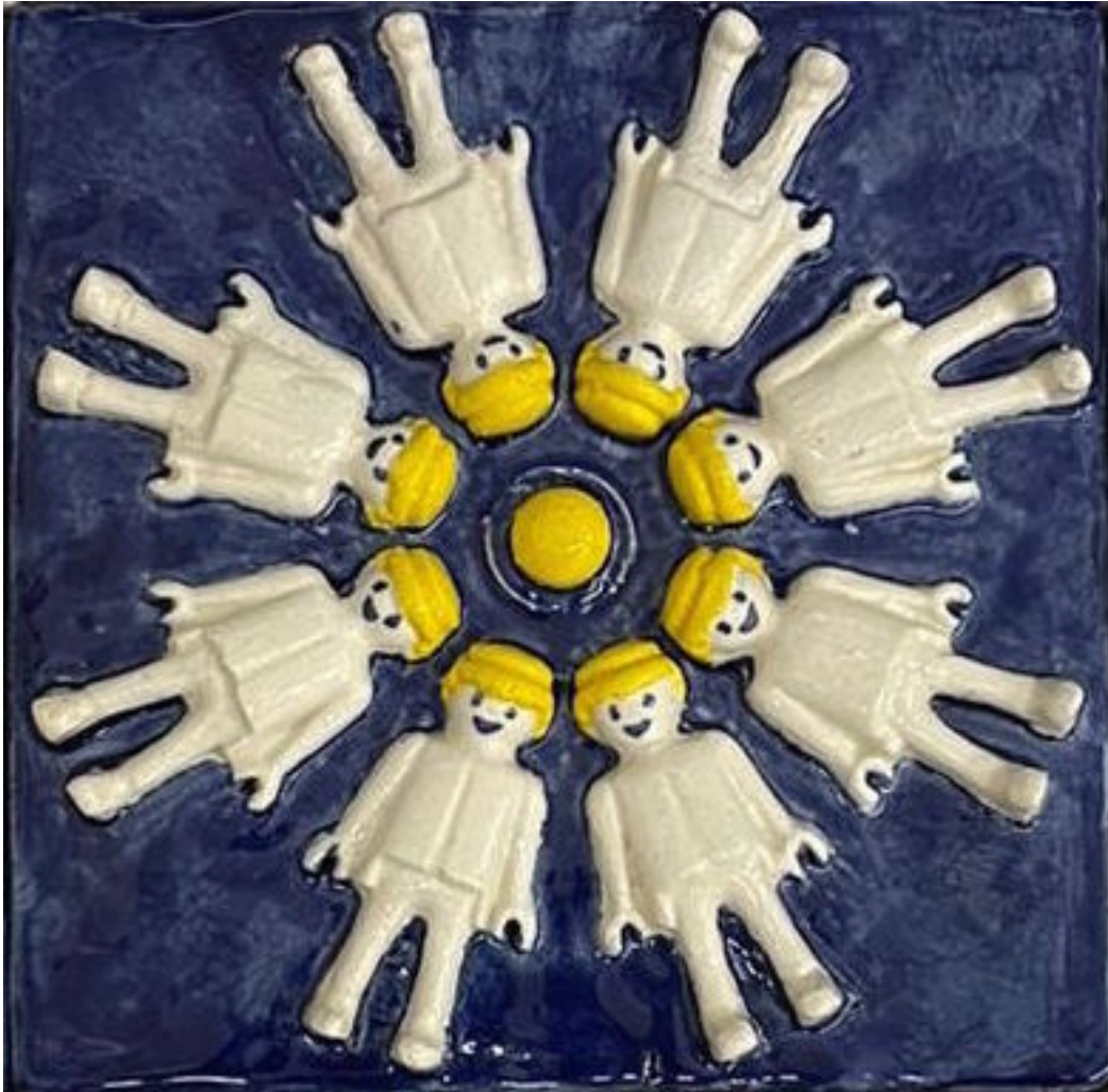
Sans titre, 2022 Céramique, pièce unique 17 x 17 cm chaque