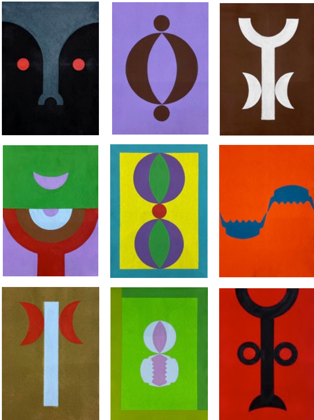
Sans titre, 2022 Acrylique sur toile 43 x 30 cm chaque