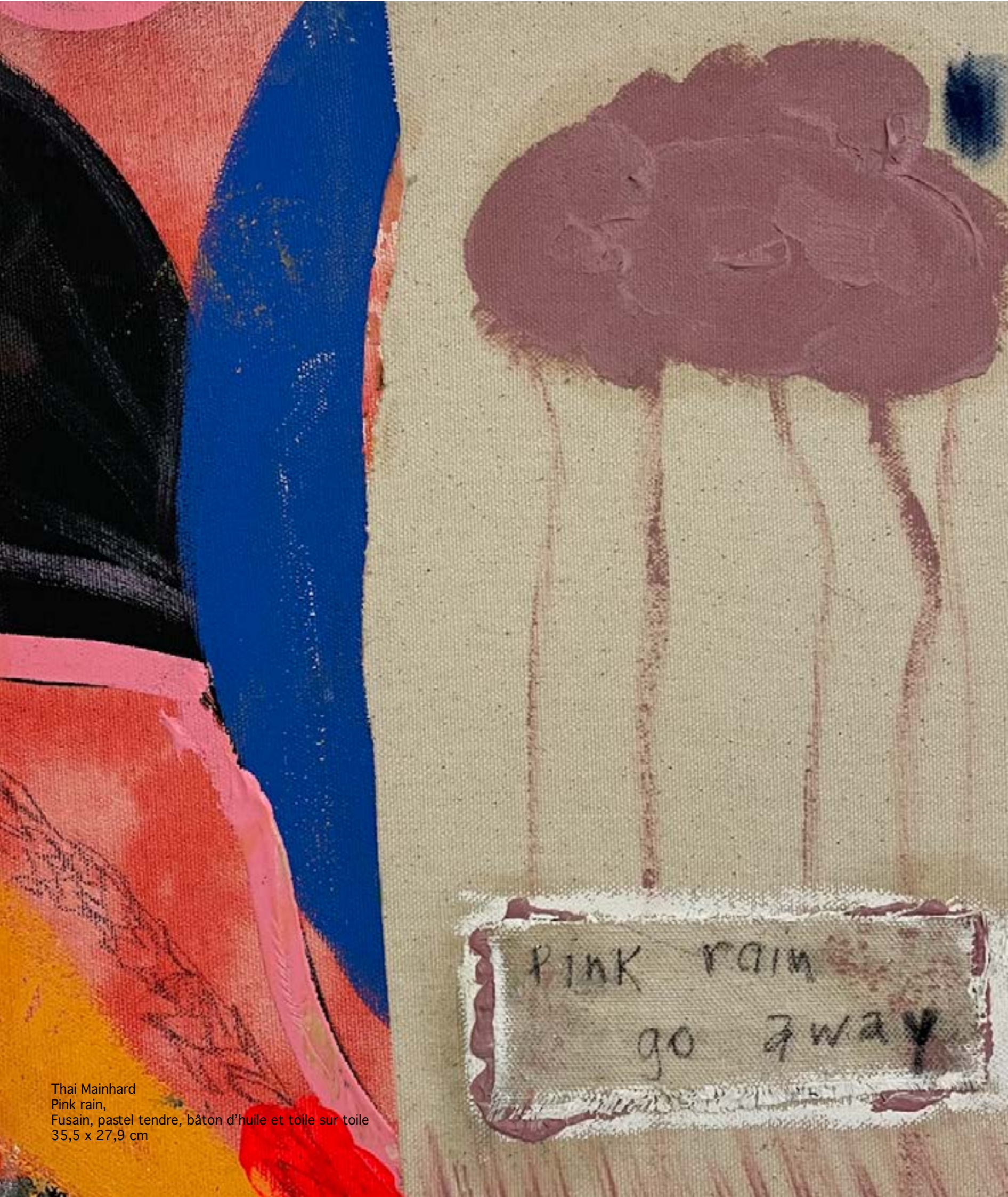
Thai Mainhard Pink rain, Fusain, pastel tendre, bâton d'huile et toile sur toile 35,5 x 27,9 cm