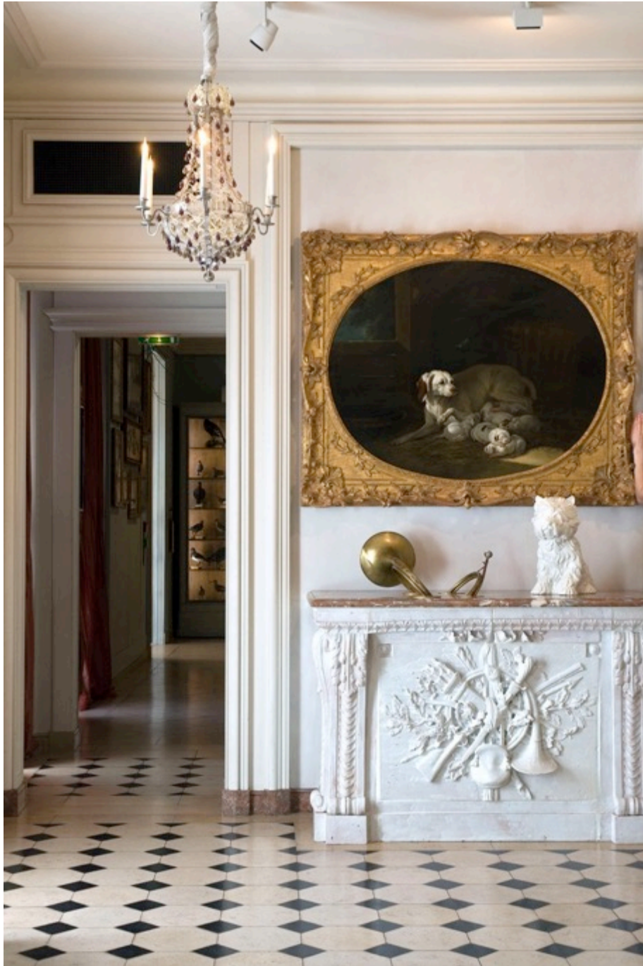
La Lice et ses petits de Jean-Baptiste Oudry (salon de 1753), poêle aux accessoires de chasse en faïence de Strasbourg (deuxième moitié du XVIIIe siècle), Carole, lustre provenant d'un théâtre (XIXe siècle), vase en porcelaine Puppie de Jeff Koons (1998). Musée de la chasse et de la nature, 2012 Tirage argentique monté sur dibon, encadrement en bois blanc, verre 3mm Ed 2/5 70 x 100 cm