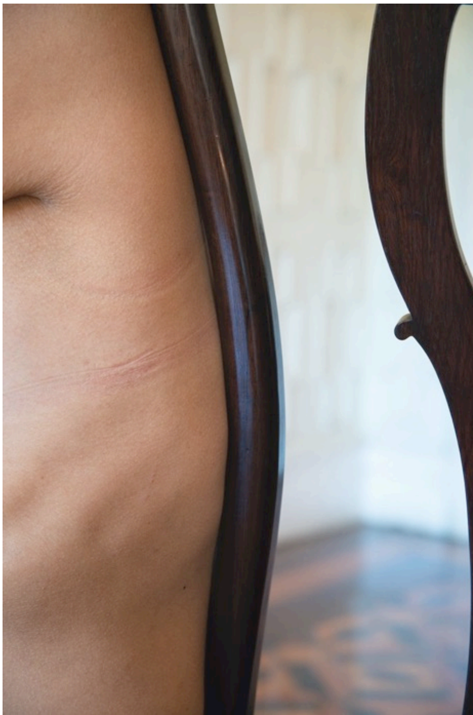
Detail of a wooden chair, Ada. Rio Negro Palace (Petropolis, Brazil), Ibram, Minc, 2015. Tirage argentique monté sur dibon, encadrement en bois blanc, verre musée Ed. 1/5 70x50 cm