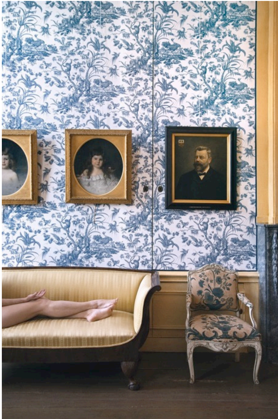
Biedermeier canapé (19th century), portrait of Louise Marguërite Van Loon by Thérèse Schwartze (1894), Juliette, Louis XV armchair (ca. 1750). Museum Van Loon (Amsterdam, Netherlands). 2018 Tirage argentique monté sur dibon, encadrement en bois blanc, verre musée Ed. 1/5 100 x 70 cm