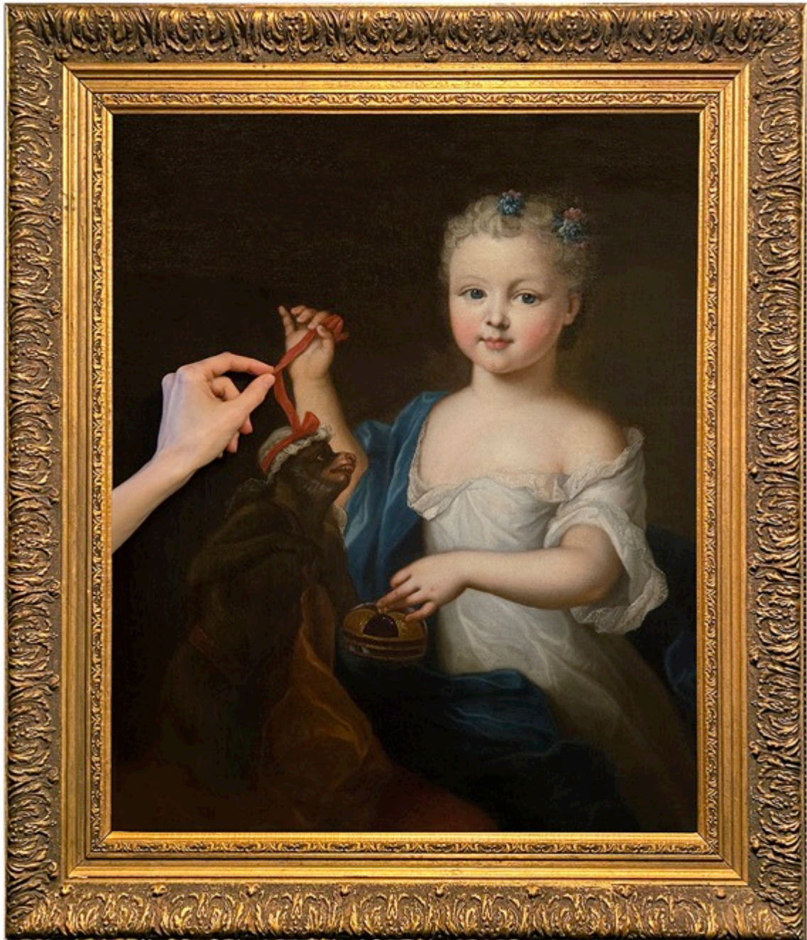
Charlotte Grimaldi enfant par Pierre Gobert (1662-1744), Carole. Palais Princier de Monaco, 2018 76 x 66 cm ED 5