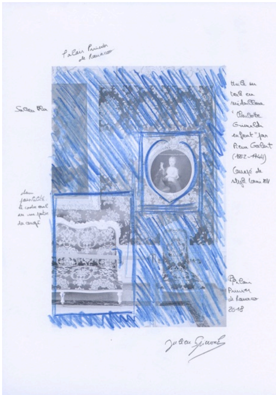
Etude. Palais Princier de Monaco, 2018 29,7 x 21 cm Pièce unique