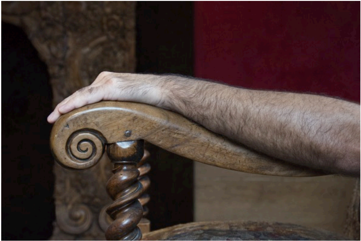
Fauteuil Louis XIII, Léopold. Maison de Balzac, 2020