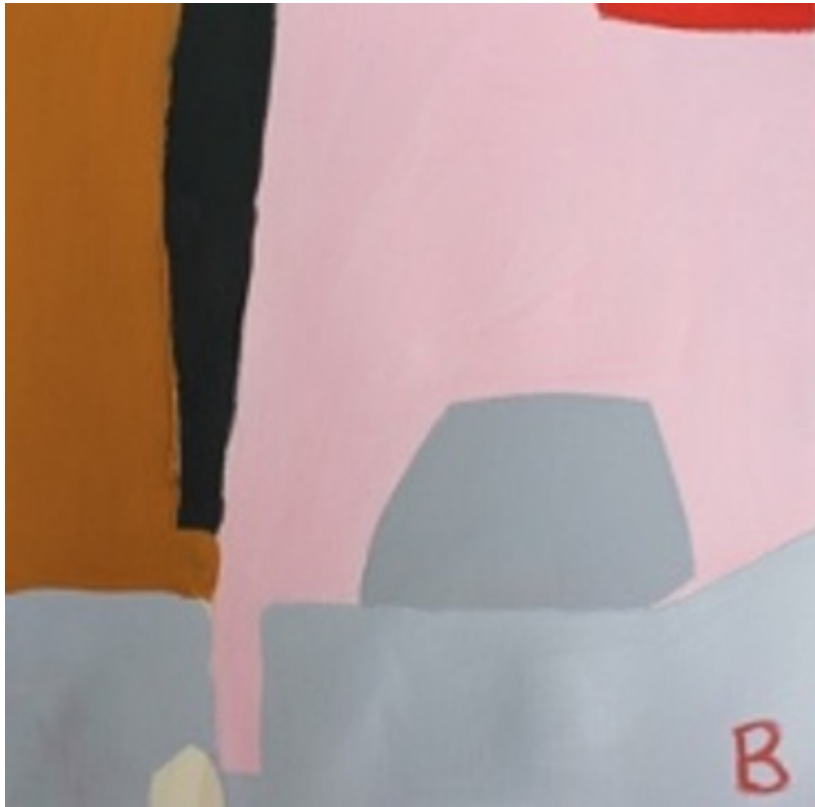
Untitled 9 , 2016 Acrylique sur papier 42 x 42 cm