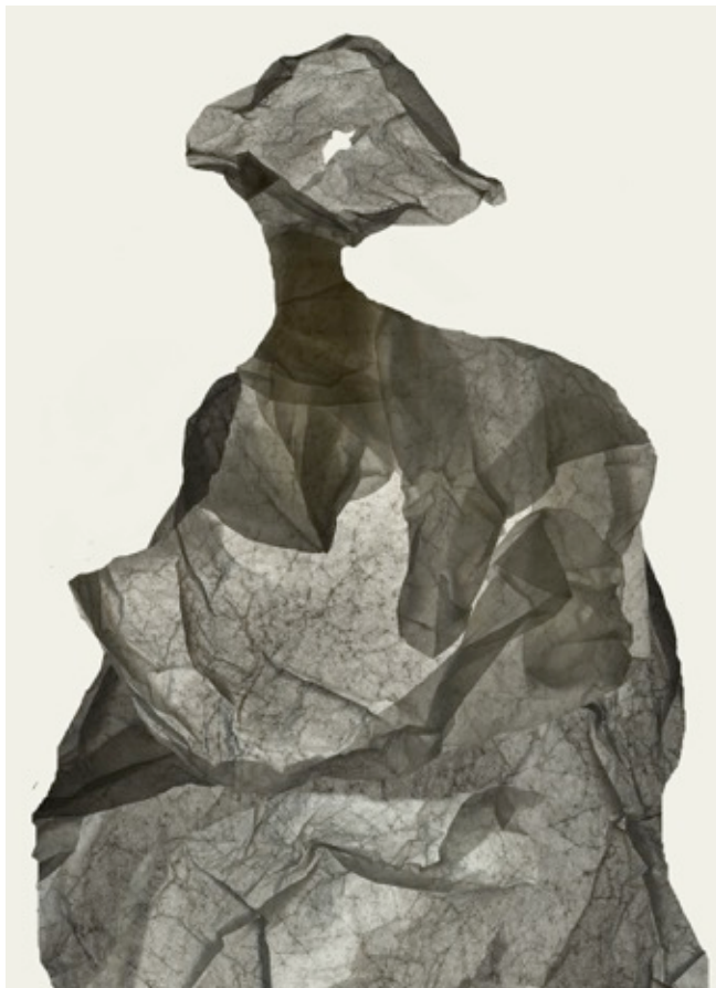
Composition 9 , 2016 Tirage sur papier COSO 70g Ed 1/5 + 2EA 17 x 24 cm