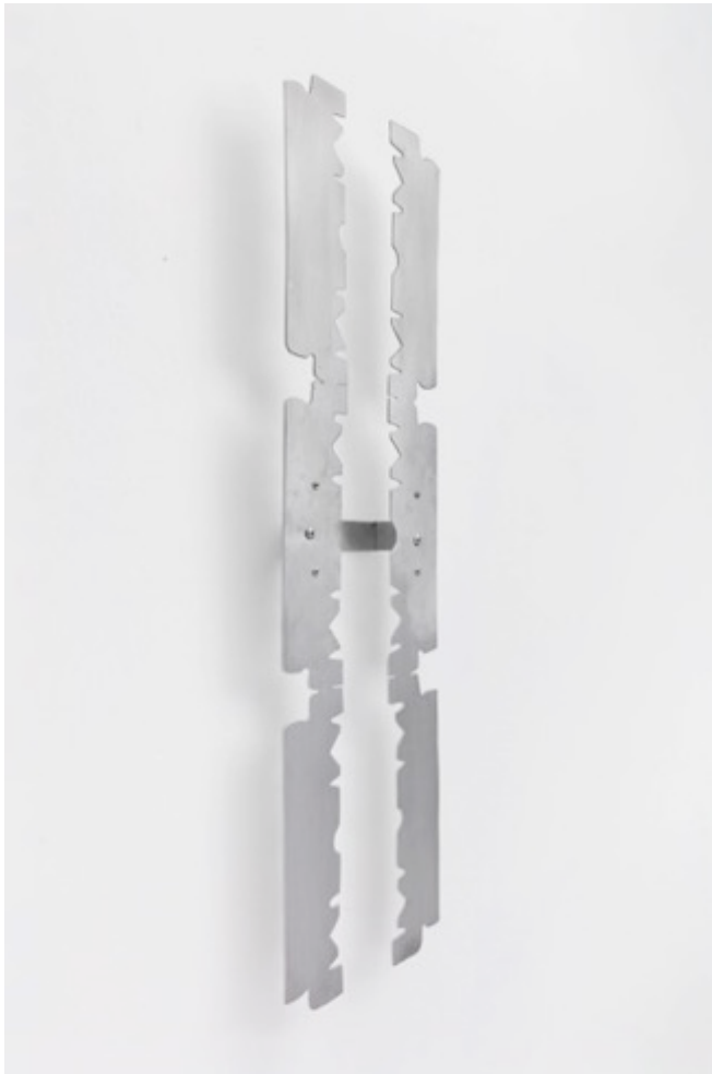
Alcinha de Gilletes (bretelle de rasoirs), 2019

Ce "plan de guérilla" comme elle a décrit consistait à l'invasion des ouvertures/vernissages au Parque Lage - qui comprenait des œuvres d'étudiants et d'artistes bien connus - comme un moyen de se positionner politiquement dans un contexte physique et symbolique qui excluait des identités comme la sienne.