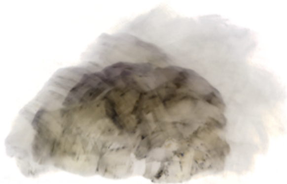
Quartz, 2018 Led lightbox Ed 1/3 + 2EA 54 x 54 x 12 cm