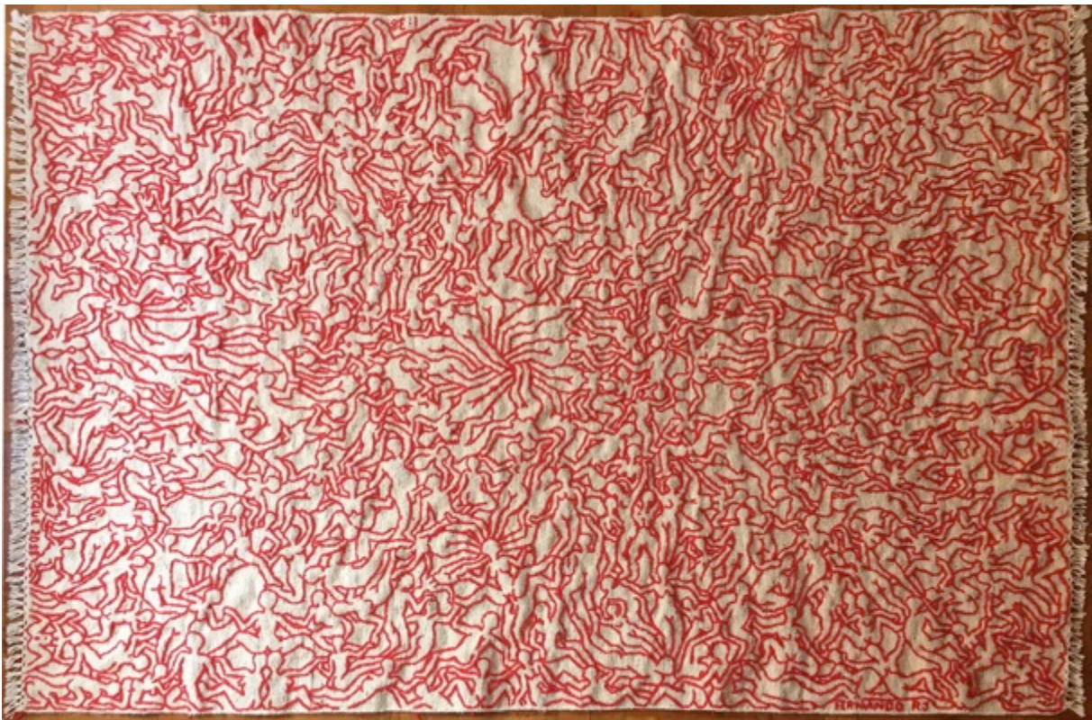
Arvore da Vida , 2018

L'utilisation de fumée d'hallucinogène est présente en tant que médium créatif dans le travail psychédélique de l'artiste. Cela a suscité des nombreux débats.