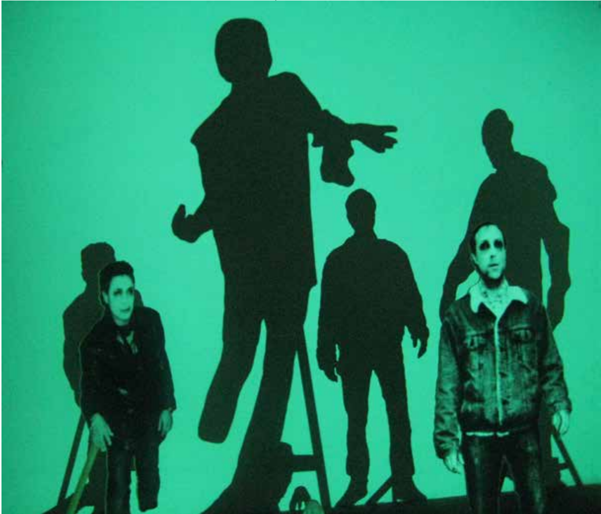
From Dusk To Dawn and All over Again, 2011 Re)loading, ECAV, Espace USEGO Sierre Photographie marouflée sur bois, cible n°3, projection animation 10:21 min.