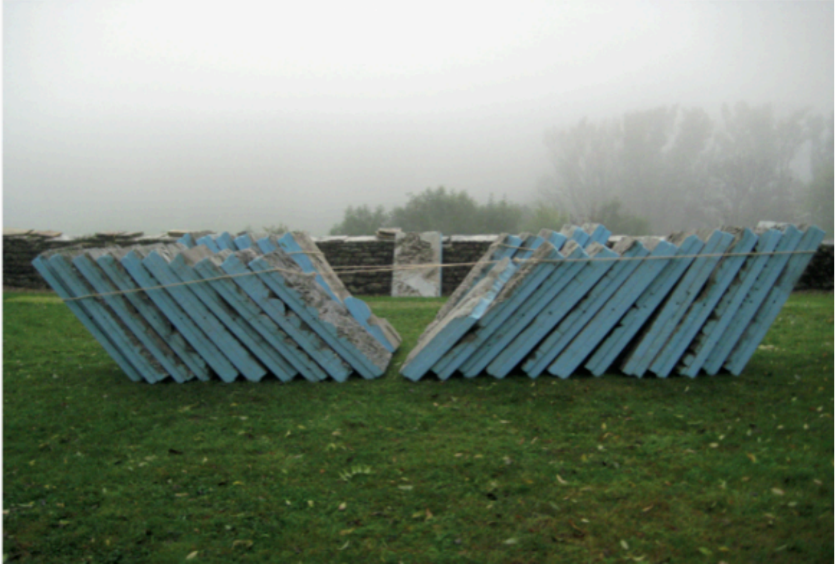
Sans Titre, 2011

Styrofoam, mixte média et corde Invitation au Voyage 2ème partie, ARCOS, Etival, France.