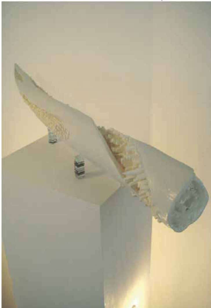
Where The Beast Stands Still, 2008 1/7 sculptures Styrofoam, socle, ampoules en série Chez Popper, Genève.