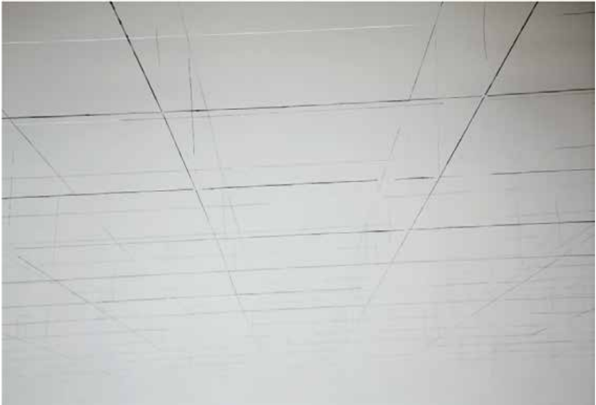
3.64 x 5.46, 2014 fils de nylon et acier, pigment noir ivoire 3.64 x 5.46 m site spécifique