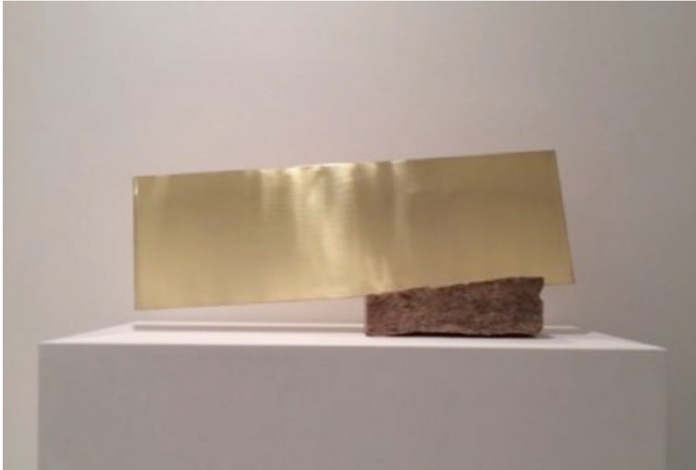
Porte à faux, 2015, Pierre, laiton Ed 1/3 32 x 63 x 12 cm