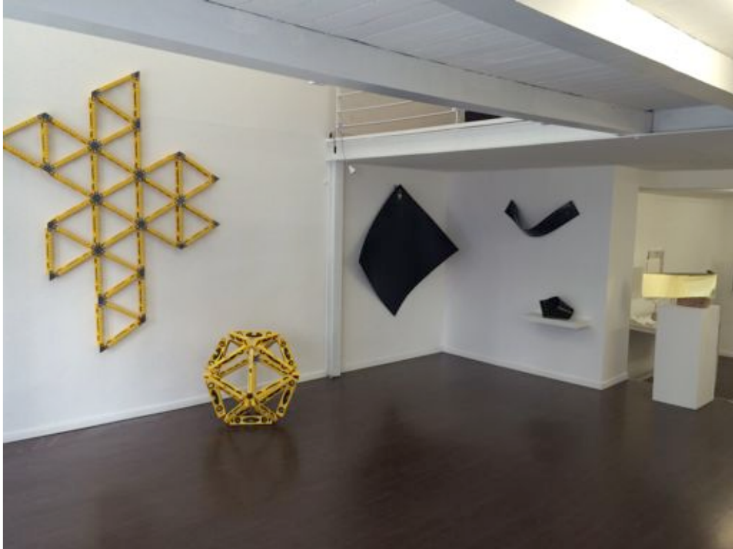
Vue d'ensemble, Couleur Matière, Espace_L, 2016