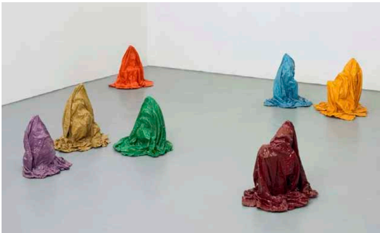
Par dessus n1, 2004 (7 pièces)